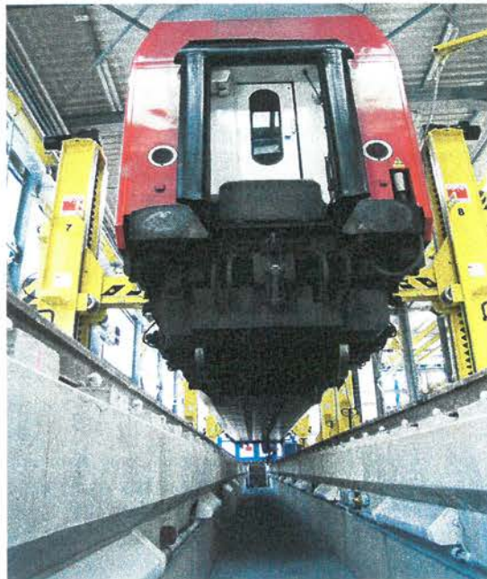
Arbeitsgrube für Schienenfahrzeuge. Inspection pit for rail vehicles.

For railway technology in particular, the Lauchhammer company is a proven partner throughout Germany and beyond for the following products: inspection pits, containment systems, track-bed slabs, track scales and prefabricated buildings.